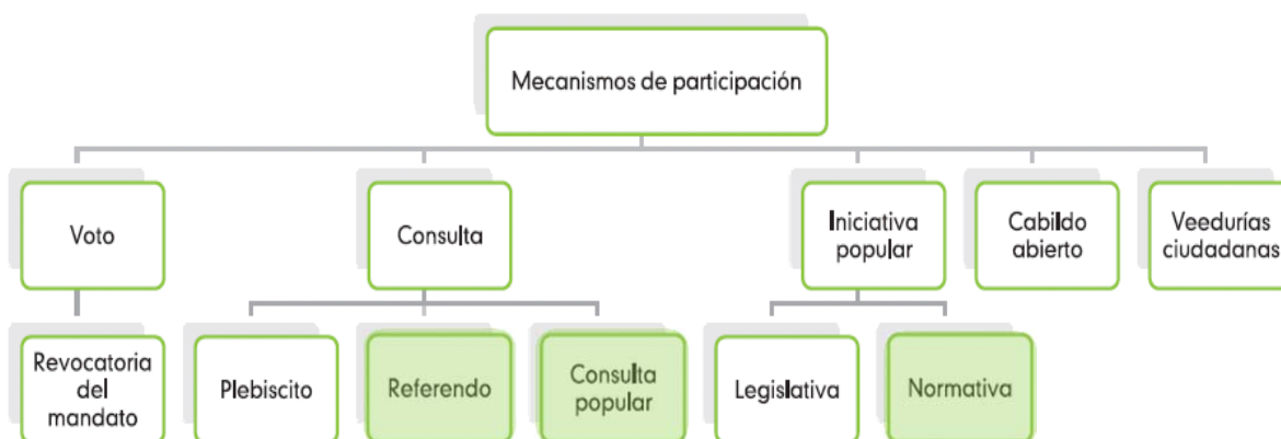
Cuadro 1. Mecanismos de participación política reglamentados

El abanico de opciones de participación política en Colombia se muestra en el cuadro 1.