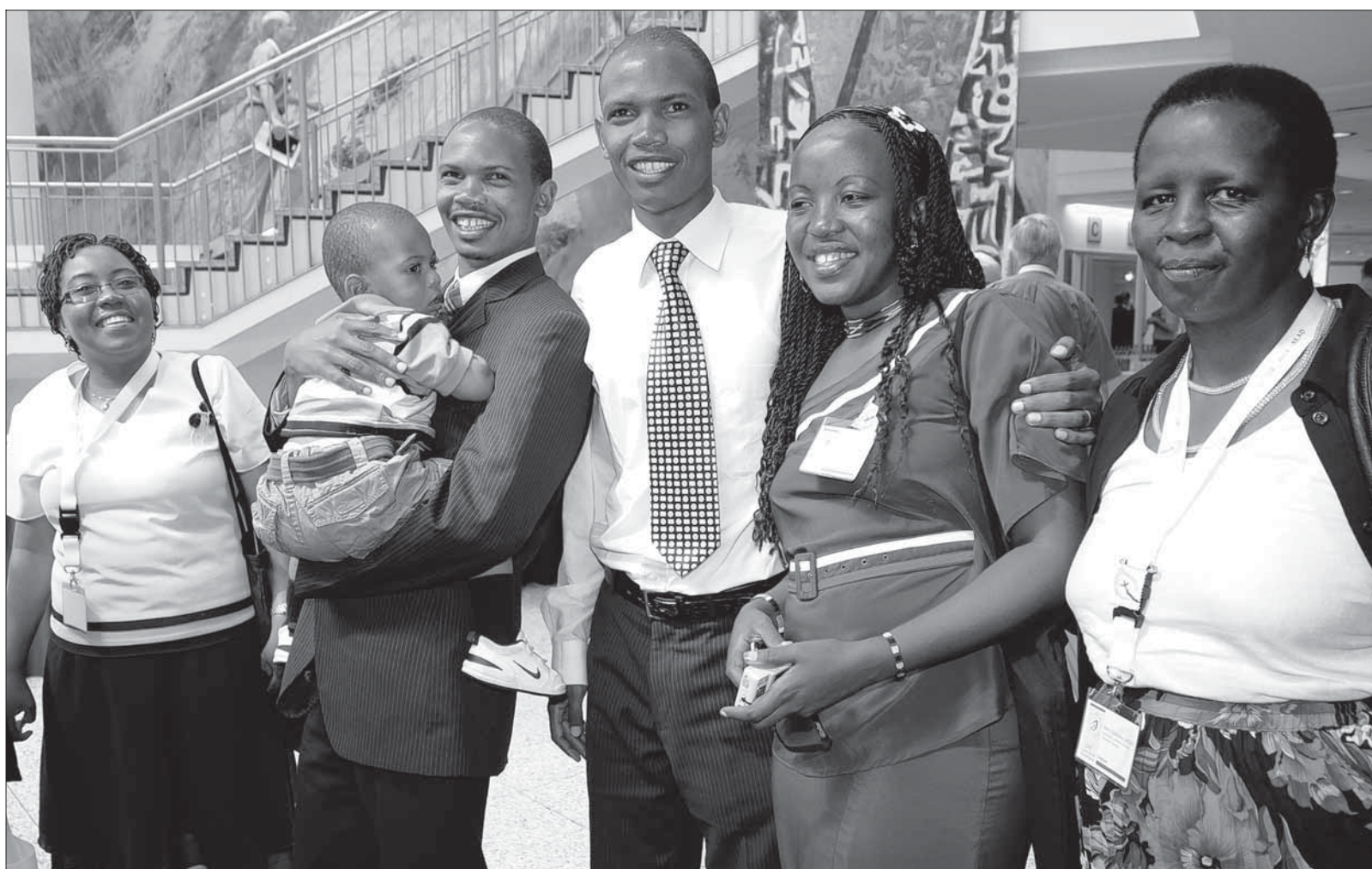
11. Vollversammlung des Lutherischen Weltbundes: Acht Tage lang stellen sich in Stuttgart rund 400 Delegierte aus den 140 Mitgliedskirchen – hier von Tansania – Fragen wie Klimawandel, Umwelterstörung oder der Kluft zwischen Arm und Reich.

In Schweden und Amerika etwa gibt man sich fortschrittlich. Dort gehören Frauen im geistlichen Amt zur Normalität, und gleichgeschlechtliche Paare dürfen mit dem Segen der Kirche rechnen. Aber so viel Freiheit kommt nicht in allen Ländern gut an. Afrika und das Baltikum zum Beispiel haben damit größere Schwierigkeiten. In Stuttgart appellierte Bischof Elisa Buberwa von Tansania an die Versammlung, den Kirchen in diesen Fragen mehr Zeit zu lassen, was auch durchaus im Sinne von Generalsekretär Ishmael Noko aus Simbabwe ist. 2007 wurde eine Arbeitsgruppe gegründet, die bis 2012 Richtlinien zu Ehe, Familie und Sexualität erarbeiten soll. Wenn diese dann allerdings verbindlich werden sollten, heißt es noch lange nicht, dass sich auch alle Mitgliedskirchen daran halten. Schließlich schrieb der LWB die Frauenordination schon 1990 in seine Verfassung.