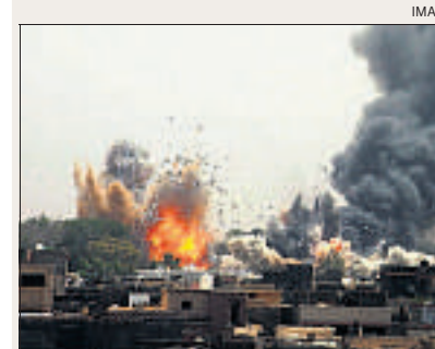
Bomben der Nato auf Tripolis. (7. Juni)

Gegenoffensive. Bereits Ende Februar schlagen Ghadhafis Truppen zurück. Die libysche Luftwaffe greift Rebellenhochburgen an. In umkämpften Städten feuern Heckenschützen auf Zivilisten. Anfang März erobern Regierungstruppen ostlibysche Küstenstädte zurück. Nato greift ein. Am 17. März erlässt der UNo-Sicherheitsrat eine Resolution. Sie sieht die Einrichtung einer Flugverbotszone und den Einsatz von Militär zum